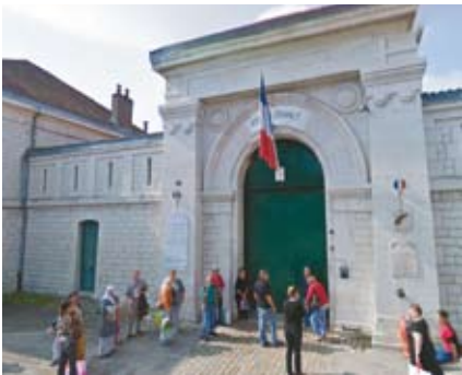
La prison de la Butte à Besançon