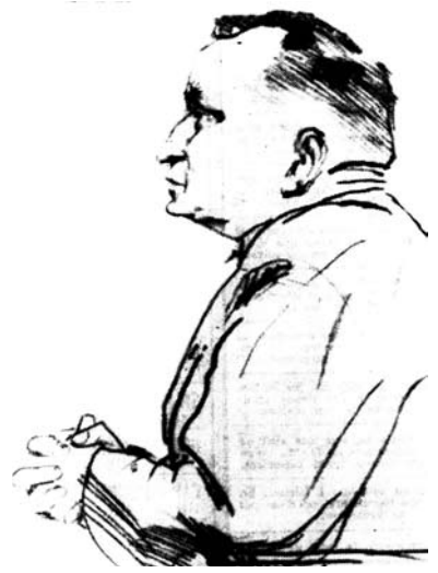
Le théologien Georges Casalis

ment sans limites viennent d'être soulignées [...] Quelles que soient les très réelles et inacceptables atrocités commises par les nationalistes algériens, justifient-elles de tels procédés, appellent-elles de telles réponses ? Faut-il que cette période de notre histoire algérienne soit marquée par ces villas où l'on torture sans que la justice sache qui est bourreau et qui est victime ? Devons-nous prendre notre parti de l'affaire Audin 20 et des dizaines de milliers d'Audin musulmans dont me parlait un de ces magistrats d'Algérie au courage civique et à la conscience desquels je me plais à rendre hommage ? Pouvons-nous accepter que la France agisse ainsi car c'est bien notre pays tout entier qui est responsable de ce qui se passe actuellement là-bas ? »