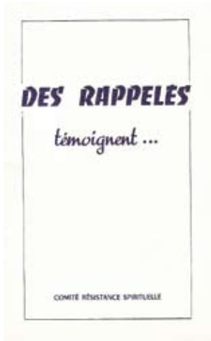
Sobre dans sa présentation, la brochure du Comité de résistance spirituelle