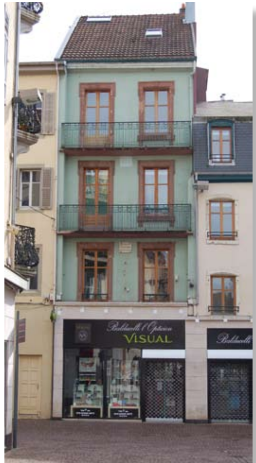
La maison natale de Georges Cuvier en 2007. Au premier étage, plaque commémorative.